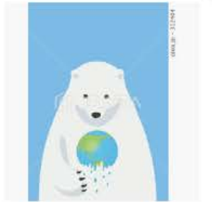
地球温暖化のイラスト素材