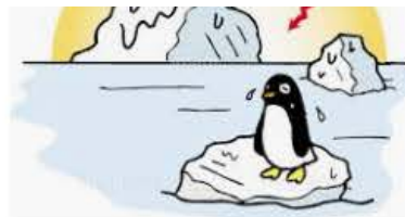
地球温暖化】の画像素材(40125132) | ...