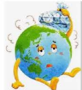
ほくにもわかる! 地球温暖...