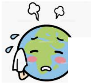
地球温暖化イラスト素材