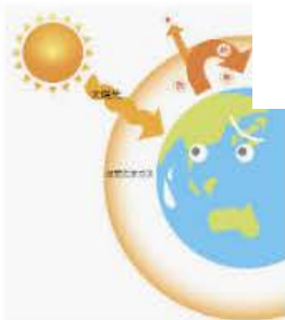
温暖化の仕組みとその影響...