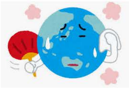
地球温暖化のイラスト「汗をかき地球のキャ...

ペンギン しろくま かわいい フリー 夏 無料 白くま 南極 素材 北極 わかり やすい 男性 写し アメリカ人 地球 異常気象 環境問題 気候変