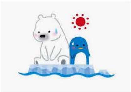
地球温暖化の現実を2コマで表したイラスト...