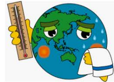
イラストポップ 学校のイラスト | 総合学習...