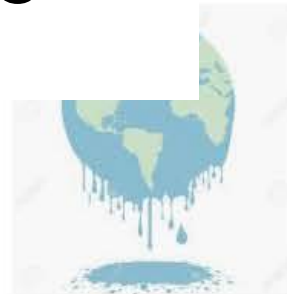
溶融地球、地球温暖化の概念...