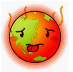
地球温暖化のイラスト | かわ...