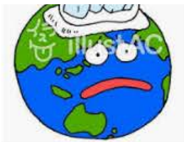
地球温暖化イラスト - No...