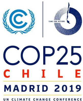
ネットワーク設置