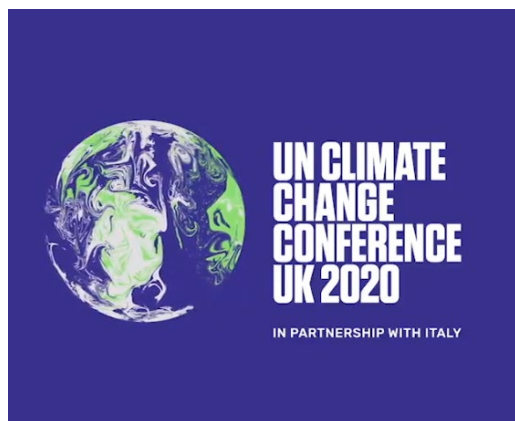
役割や機能の決定